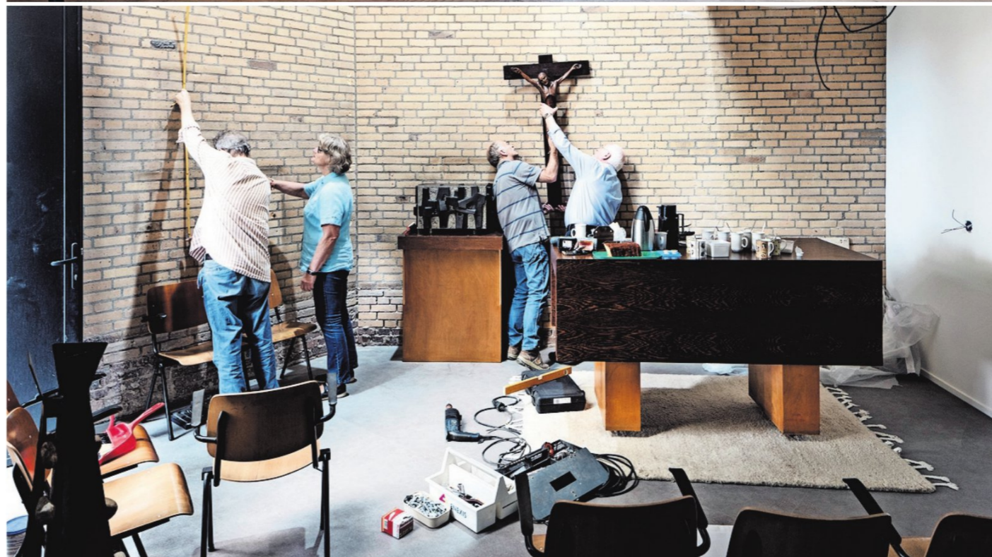
De herbestemming van de Onze-Lieve-Vrouw van Altijddurende Bijstandkerk in Kunrade is in volle gang. De kapel (onder) is bijna klaar.

Trouw deed uitgebreid onderzoek naar de herbestemming van kerken in Nederland. Van de bijna 6900 kerken die Nederland rijk is, heeft een kleine 1400 een andere bestemming gekregen, blijkt uit het onderzoek. Die bestemmingen variëren flink: van theater tot trampolinedpark tot expositieruimte tot